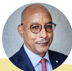
IBRAHIM MAYAKI (Union Africaine)