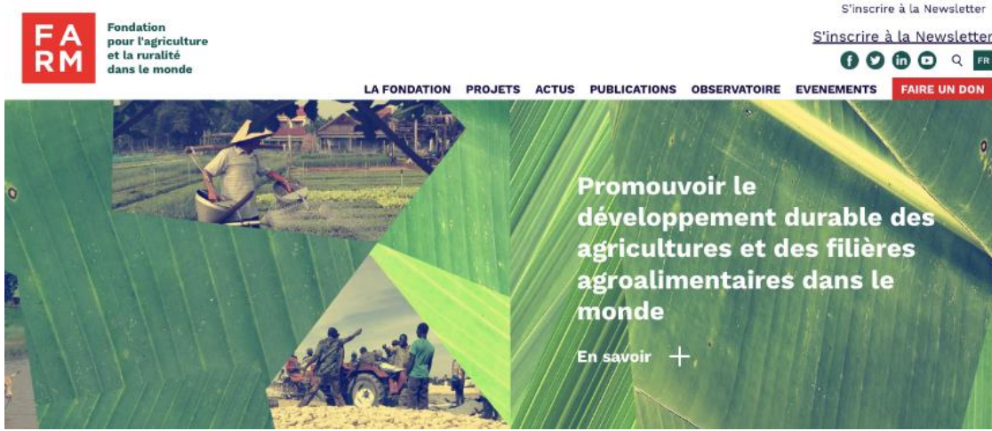
Capture de la page d'accueil du site web de la Fondation FARM

Le site est la vitrine de la Fondation. Il réunit les actions et les publications sur ses trois grands thèmes de prédilection : la sécurité alimentaire et nutritionnelle ; les filières, des producteurs aux marchés ; la résilience des territoires ruraux.