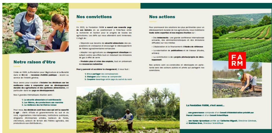
Les pages intérieures de la brochure FARM

Enfin, une brochure de 4 pages en français et en anglais présentant la Fondation a été réalisée.